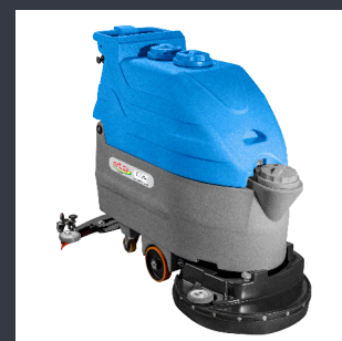
AL 450 E/B